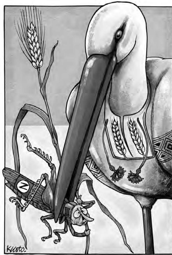
По городі бузько ходить.